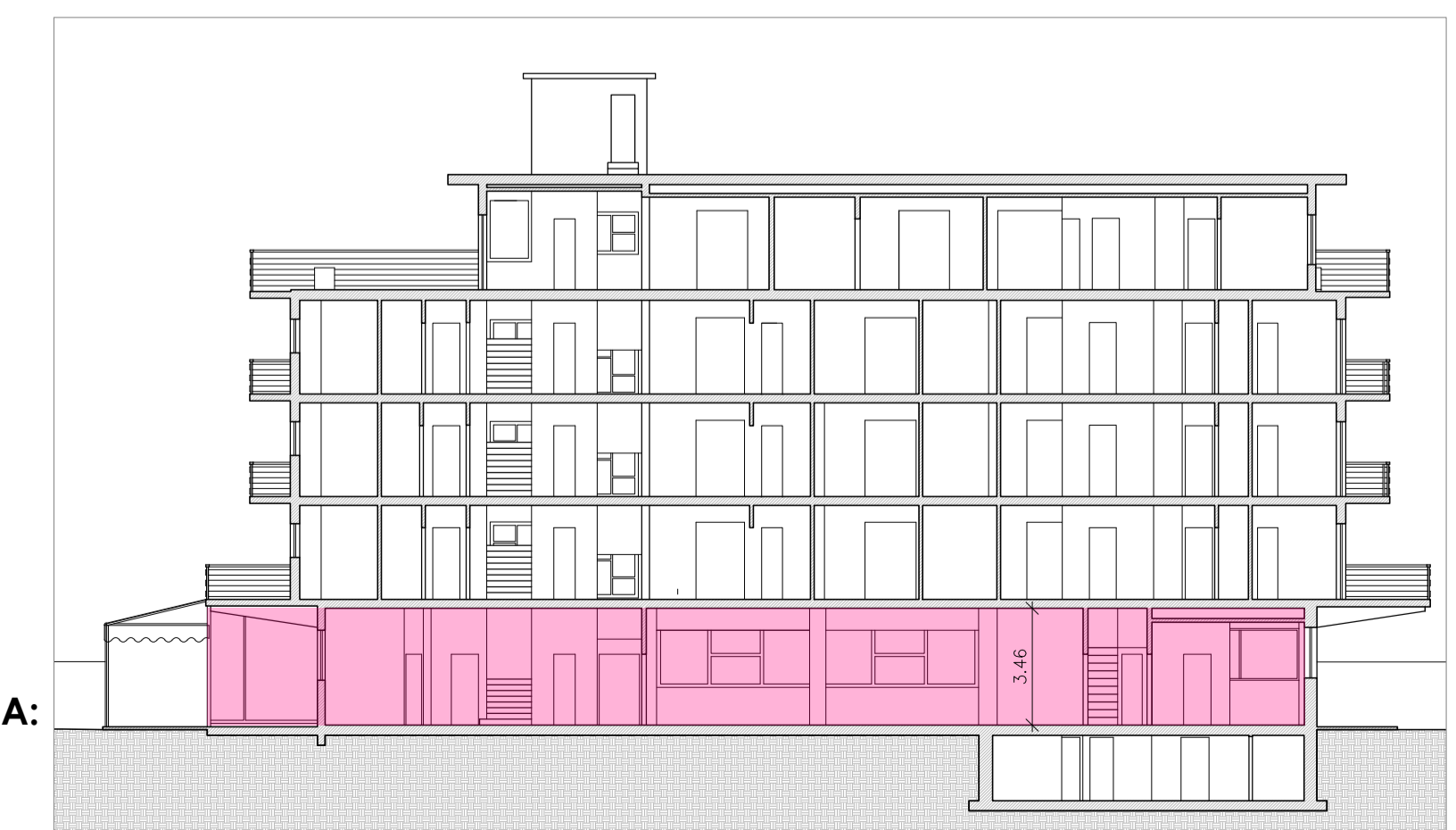
SEZIONE B-B' - SCALA 1:200