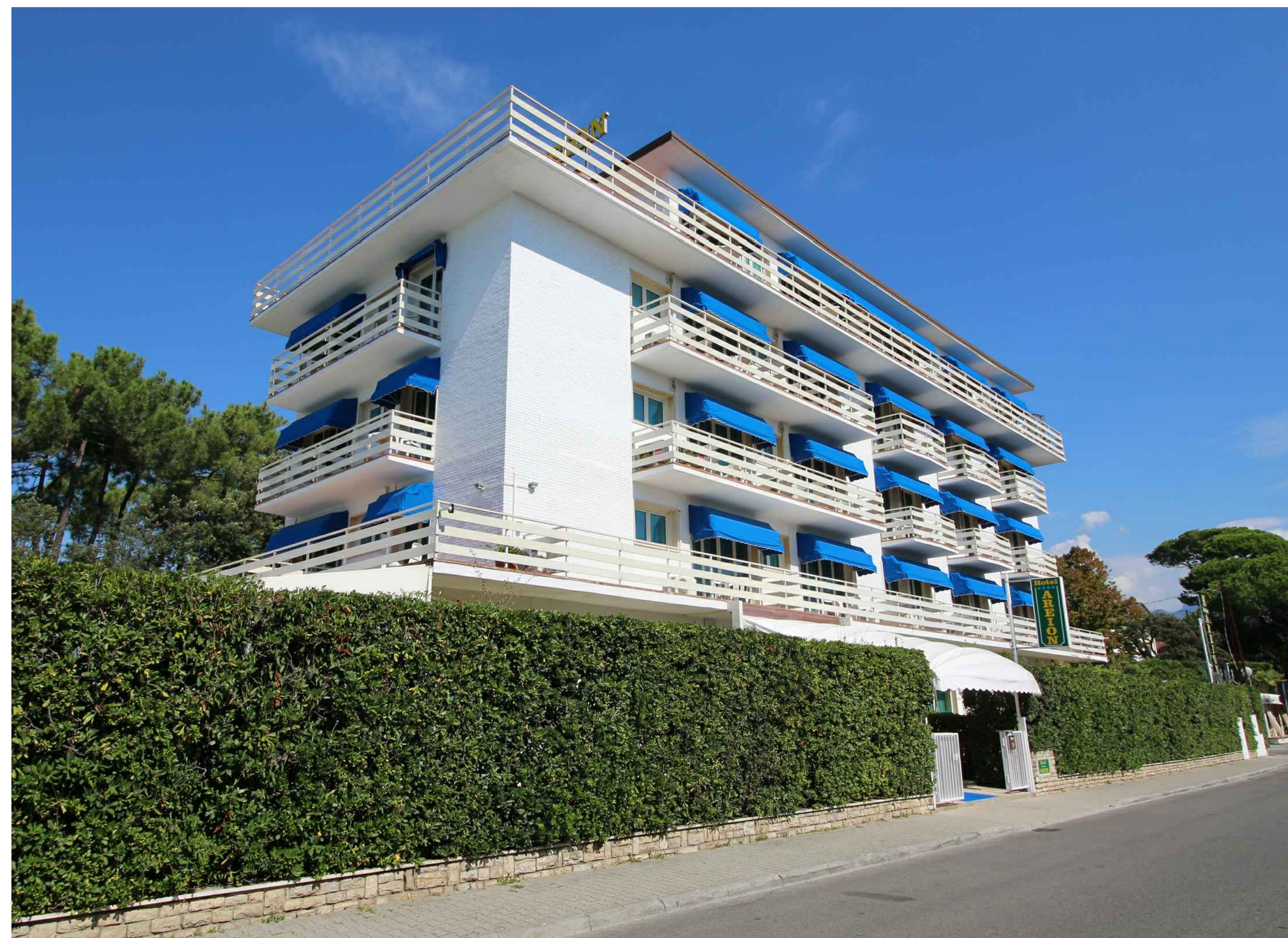
VISTA 2 - STATO DI FATTO