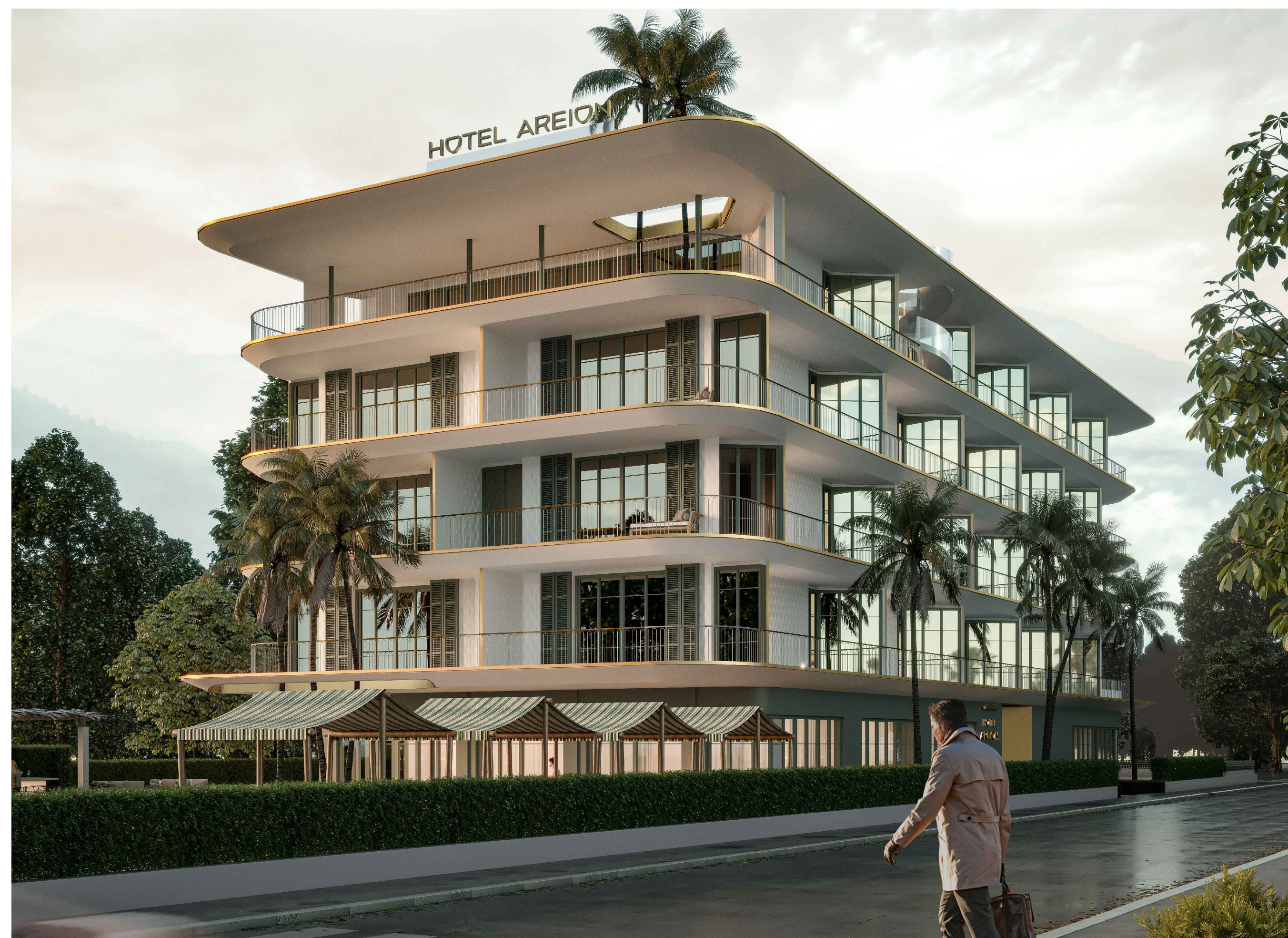
VISTA 2 - STATO DI PROGETTO - ANGOLO VIALE DELLA REPUBBLICA - VIA CAIO DUILIO

A - Data: NOVEMBRE 2022 B - Scala: C - Progetto: 21F10 Spazio riservato all'ufficio